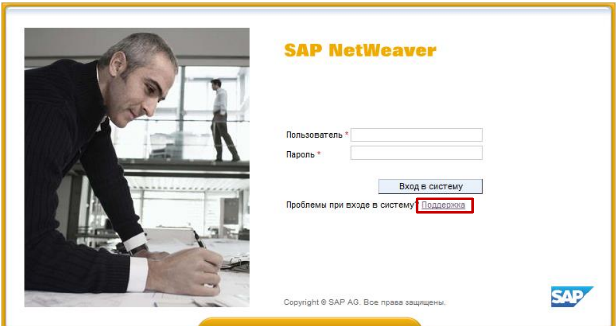
Рис.4. Техническая поддержка при входе в систему

На первоначальном экране нажмите на ссылку «Поддержка»: