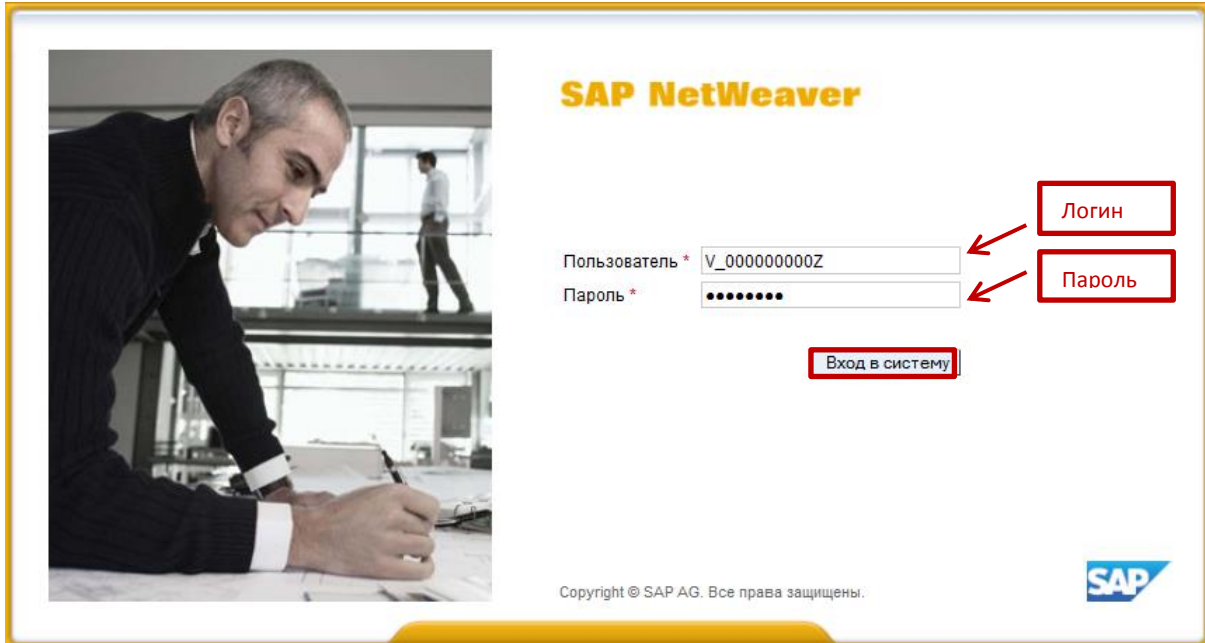
Рис.2. Вход в систему SRM

При первоначальном входе потребуется изменить пароль. Откроется экран, где в поле «Старый пароль» - необходимо ввести первоначальный пароль, в поля «Новый пароль» и «Подтвердить пароль» - ввести новый пароль, который вам необходимо придумать самостоятельно. Далее для входа в систему необходимо нажать на кнопку «Изменить».