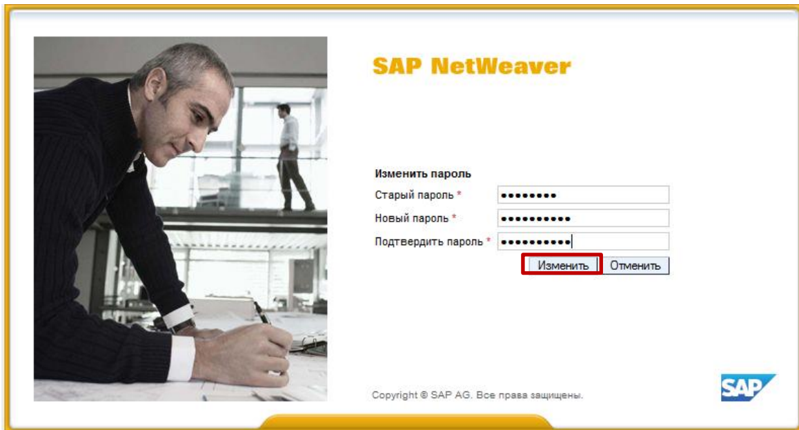
Рис.3. Регистрация нового пароля